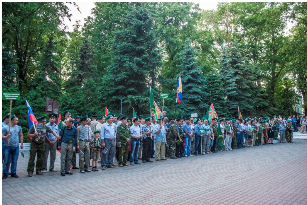
Общее построение ветеранов ПВ по пограничным округам.