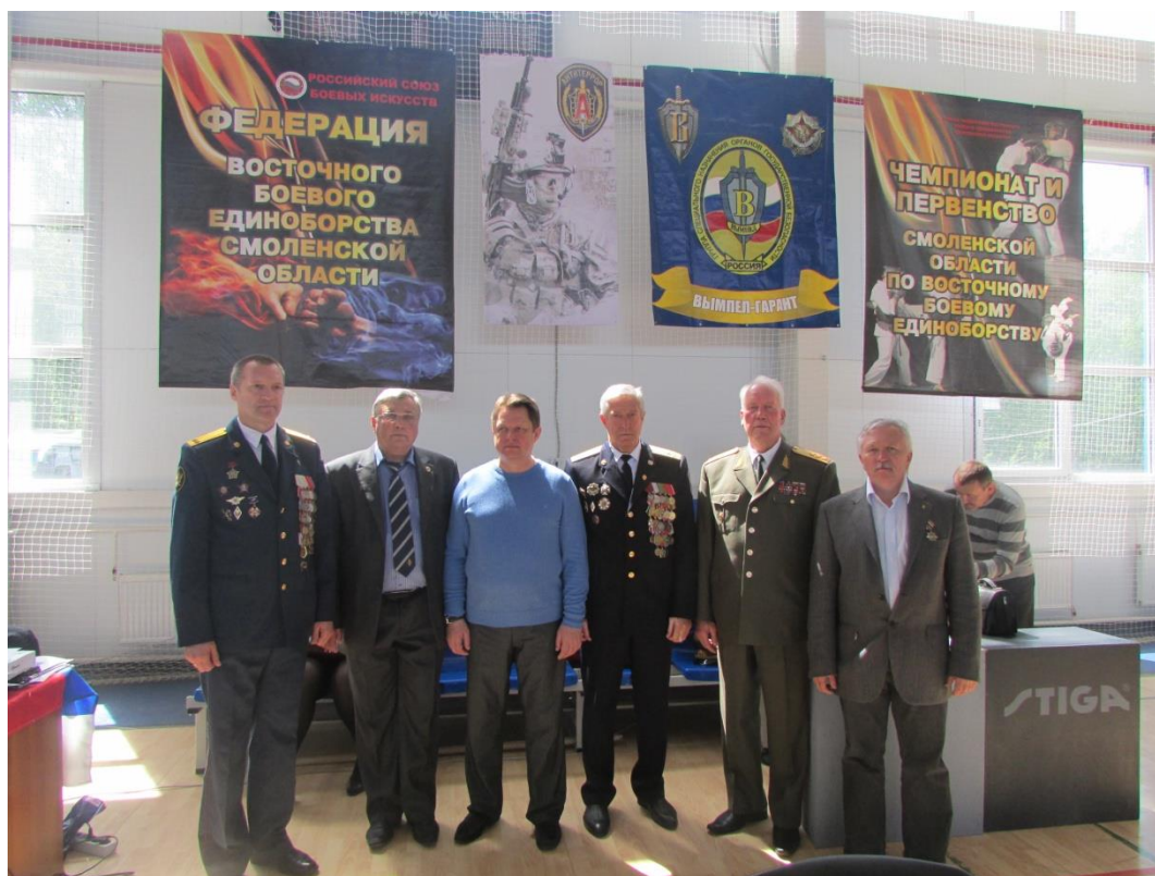
Памятные фотографии о турнире