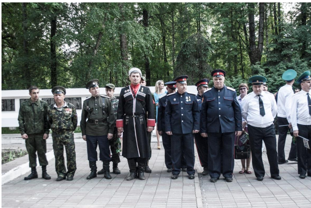
На фотографии представители казачества и действующие сотрудники пограничной службы.