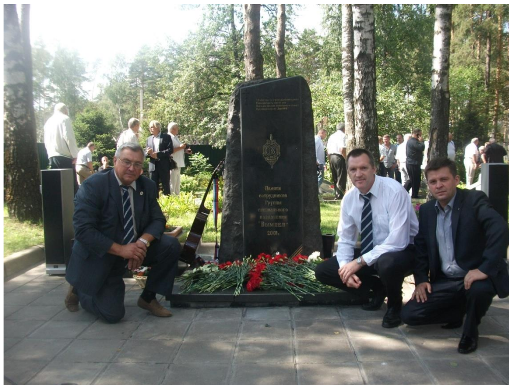
Участники Смоленского Фонда «Вымпел-Гарант»